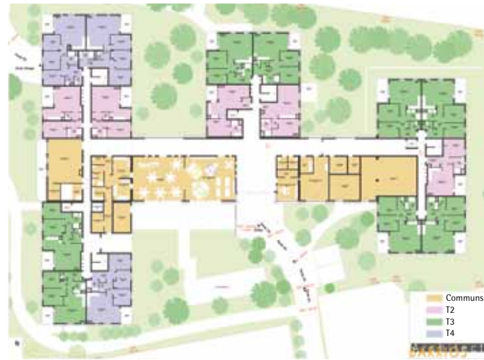
Rez-de chaussée avec légende sur parties communes...

Cette résidence se construirait au nord de la place du Champ de Mars avec un accès véhicules par l'allée des roseaux et une entrée principale côté place. Le projet va s'échelonner sur deux ans. Lorsque le calendrier sera précis, une deuxième réunion publique sera proposée. En attendant, si vous voulez en savoir plus sur les résidences seniors de la SEMCODA, retrouvez les informations sur www.seniors.semcoda.com