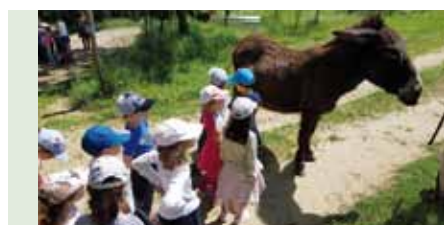
7 Vie de l'école