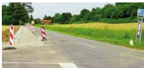
5 Liaison piétonne