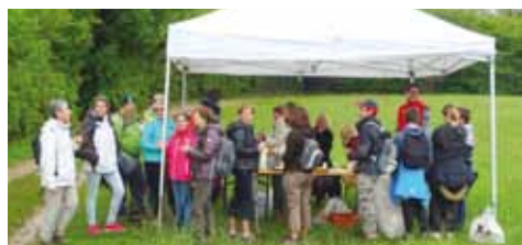
4 Marennoise du Cœur