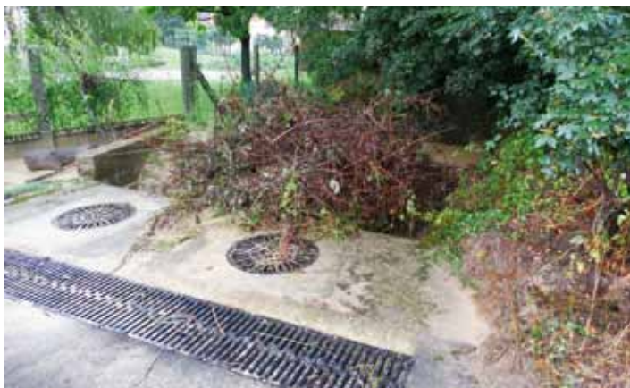
Combe de Noyon : Ces aléas météorologiques sont l'occasion de rappeler que les combes ne sont pas des déchèteries pour débris végétaux.