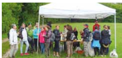
4 Marennoise du Cœur