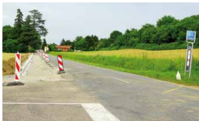
« Liaison piétonne ».

L'entreprise Roger Martin a réalisé les travaux pour le compte de la CCPO.