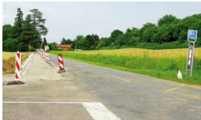
« Liaison piétonne ».

L'entreprise Roger Martin a réalisé les travaux pour le compte de la CCPO.