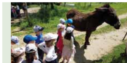
7 Vie de l'école