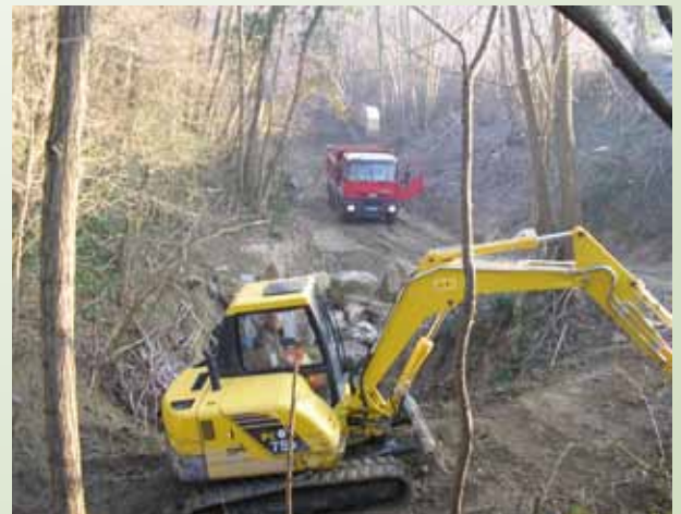
Curage de la combe de Noyon