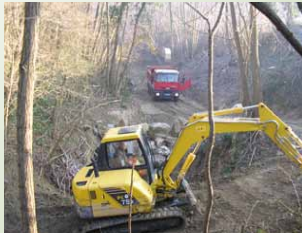
Curage de la combe de Noyon