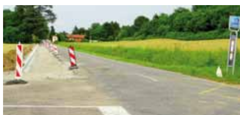
5 Liaison piétonne