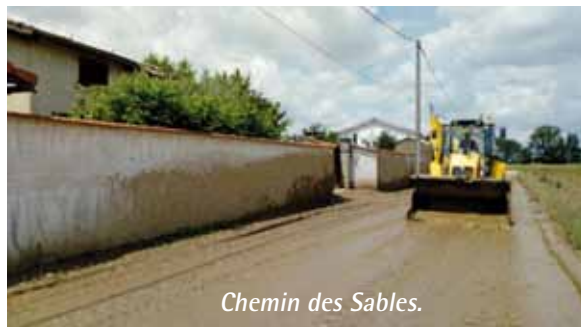
Chemin des Sables.

Les risques de crues et de coulées de boue sont, hélas... d'actualité en ce printemps 2018. Jeudi 7 juin, en quelques heures il est tombé environ 45 mm au village de Marennes et entre 70 et 80 mm sur les coteaux des balmes et des trombes d'eau sont arrivées subitement par les combes (du 1 er au 12 juin, 127 mm enregistrés ; par comparaison en moyenne sur l'année 825 mm). Le bassin de rétention de la combe de Noyon a heureusement limité les dégâts. Nous remercions toutes les personnes qui par leur réactivité et leur implication ont permis de limiter les nuisances.