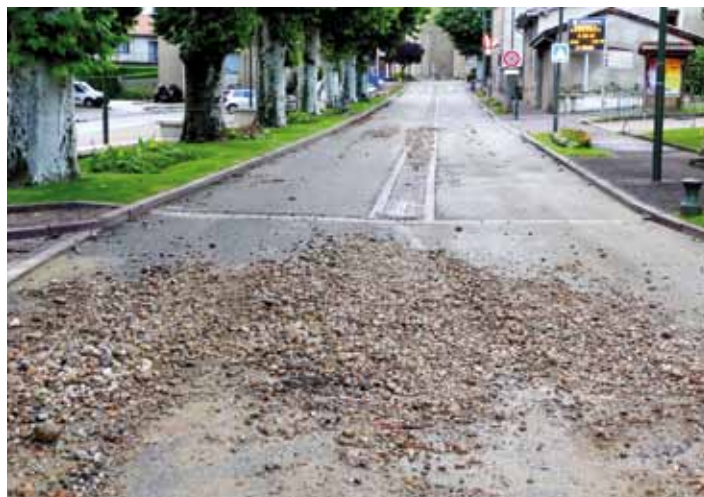
Rue Centrale le 8 juin à 7h.