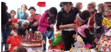
2 Fête du Village

Police 17 Pompiers 18 Depuis un téléphone portable 112 SAMU 15