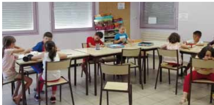
Dans la salle de garderie, les coloriages et les jeux de cartes sont les activités préférées...