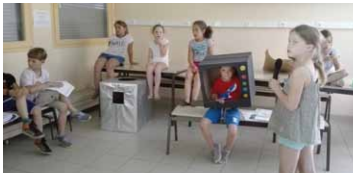
L'atelier théâtre nous réserve de belles surprises pour la fête de l'école au stade....