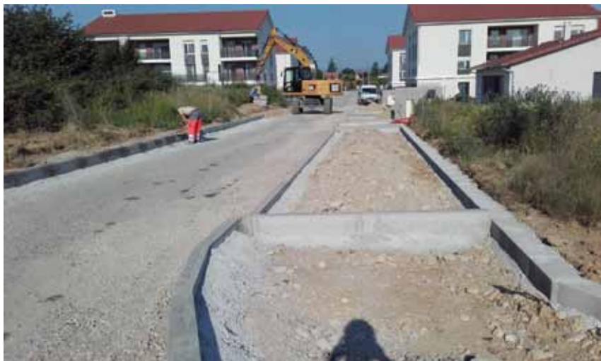
Les trottoirs et voiries sont en cours de réalisation.

L'aménagement du centre village se précise. Après les voiries et les trottoirs, à l'automne ce sera au tour de l'engazonnement et des plantations. Tout ceci afin d'améliorer les accès et le bien-être de la quinzaine de familles déjà installées.