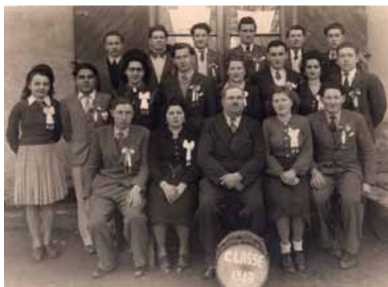
Des conscrits de la classe en 7 ! Avec quelques années d'écart !

Le samedi 16 septembre, les classards seront sur leur char, décoré pour l'occasion, et se feront entendre en passant dans les rues de Marennes et sur la grande place du village. Approchez-vous pour les saluer, acheter une brioche et profiter de leur bonne humeur et de belles surprises.