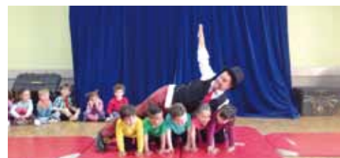
7 Vie de l'Ecole