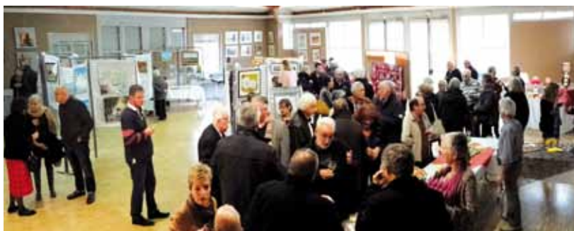
Moment de partage autour du verre de l'amitié.

Cette journée conviviale, faite de rencontres et d'amitiés constitue un moment riche en échanges entre les exposants et le public.