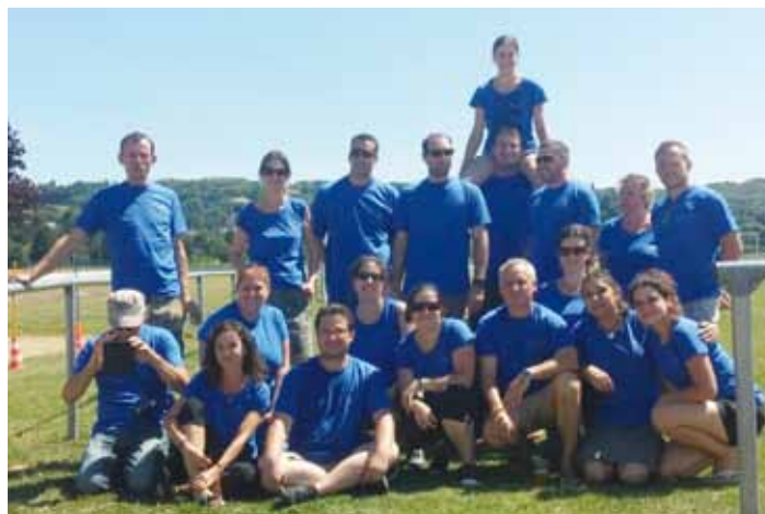
Les bénévoles lors de la fête de fin d'année, au stade.