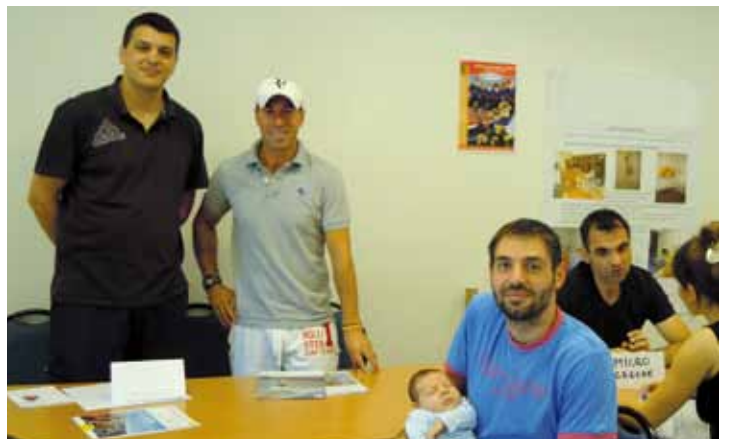
Le Tennis Club de Marennes présent au forum de septembre.

Pour tout renseignement, veuillez contacter A. Descollonges au 06 20 26 46 41