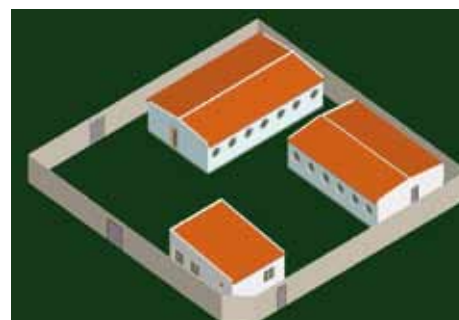
Esquisse du Projet de Ferme comprenant : Local pour Femmes + Poulailler + Porcherie

Si vous souhaitez rejoindre notre équipe vous pouvez prendre contact avec :