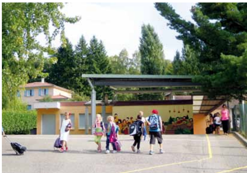
A chacun son espace...