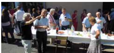
5 Forum des Associations