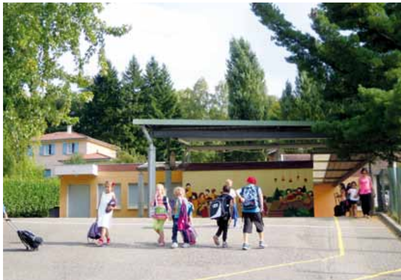
A chacun son espace...