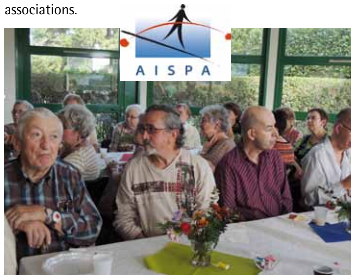
Goûter festif, moment convivial entre usagers et bénévoles.