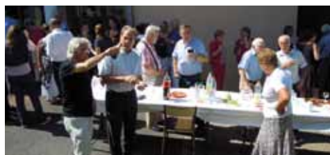
5 Forum des Associations