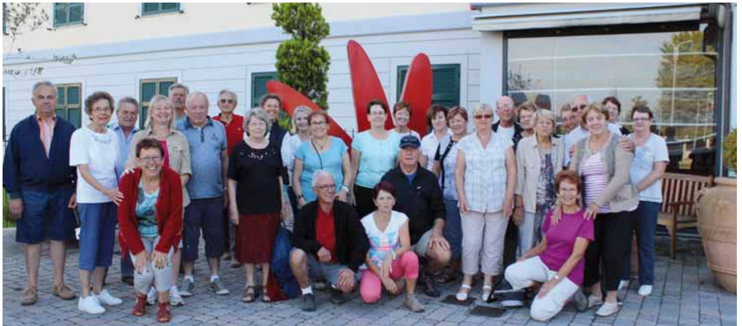
Sortie de septembre, en Italie.