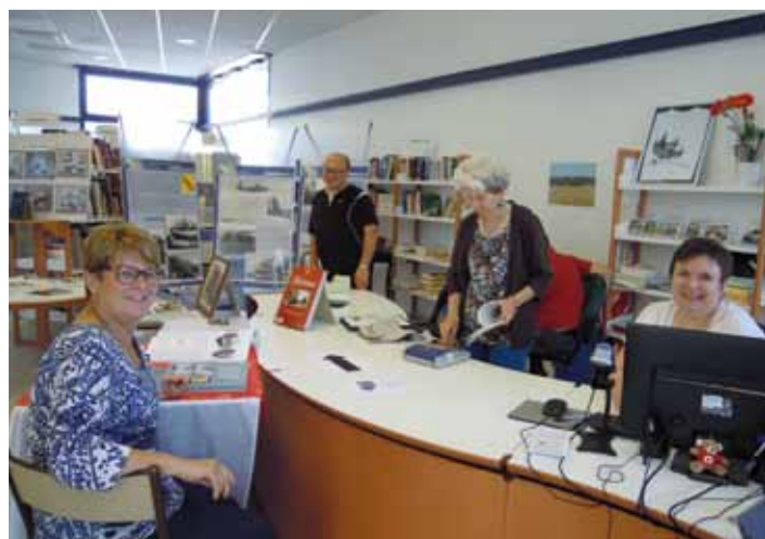
Les bénévoles de la bibliothèque sous le feu de l'action...