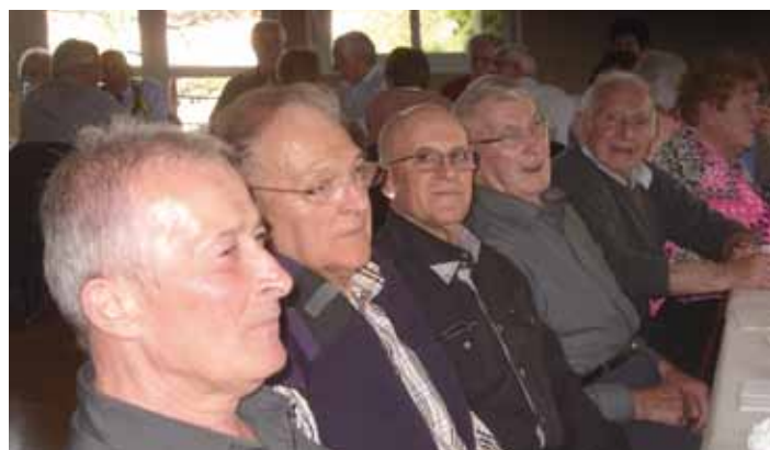
Marennois de toutes générations !

La réunion des anciens est annuelle ; elle est suivie de l'assemblée générale et d'un apéritif, puis d'un repas, dans une ambiance musicale.