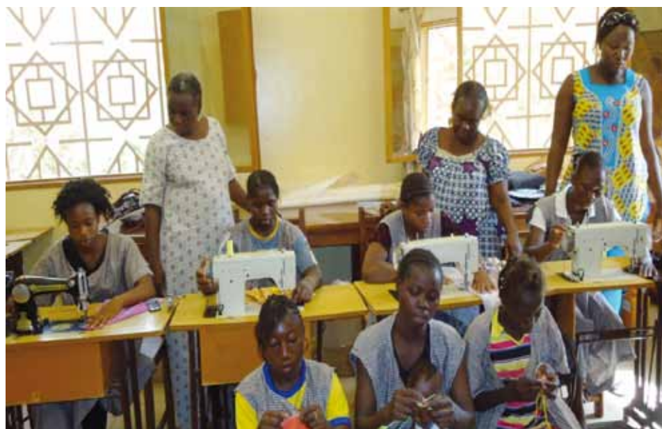
Activités pour enfants et jeunes mamans à l'Hôtel Maternel.

Le projet de ferme pour des veuves avec enfants se concrétise à Saaba (15 km de la capitale). Nous aurons prochainement des nouvelles et des photos des constructions qui ont commencé (porcherie et poulailler) par un ami burkinabé qui rentre à Lyon.