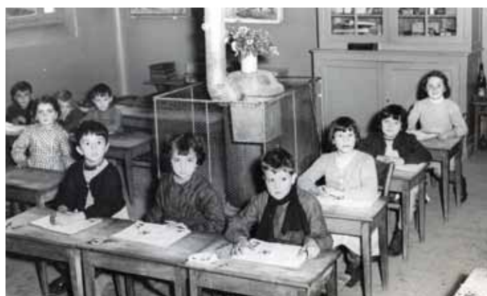
Classe des années 1950. Les élèves travaillaient 30 heures par semaine et ne connaissaient pas les nouveaux rythmes scolaires.