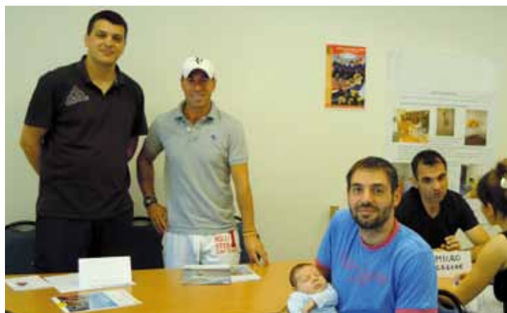
Le Tennis Club de Marennes présent au forum de septembre.

Pour tout renseignement, veuillez contacter A. Descollonges au 06 20 26 46 41