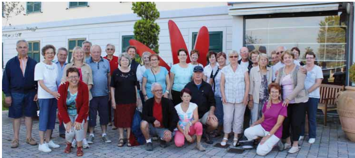
Sortie de septembre, en Italie.