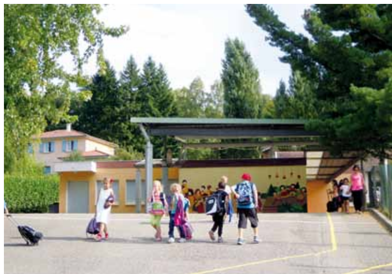
A chacun son espace...