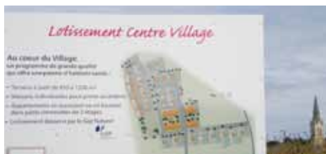
5 Nouveau quartier