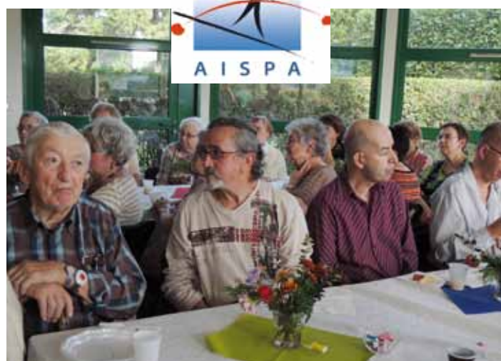
Goûter festif, moment convivial entre usagers et bénévoles.