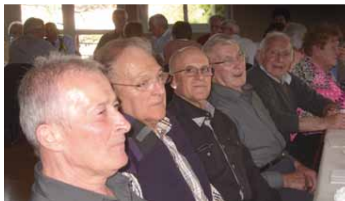
Marennois de toutes générations !

La réunion des anciens est annuelle ; elle est suivie de l'assemblée générale et d'un apéritif, puis d'un repas, dans une ambiance musicale.