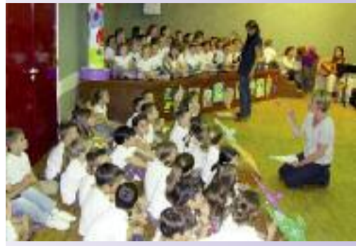
Chorale des enfants de Primaire.

Pour la sécurité de nos enfants, nous demandons à nouveau à leurs parents de bien vouloir se garer, aux heures d'entrée et sortie scolaire,