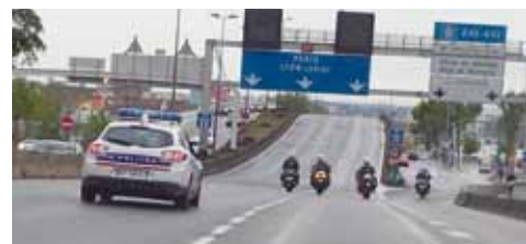
7 Opération escargot