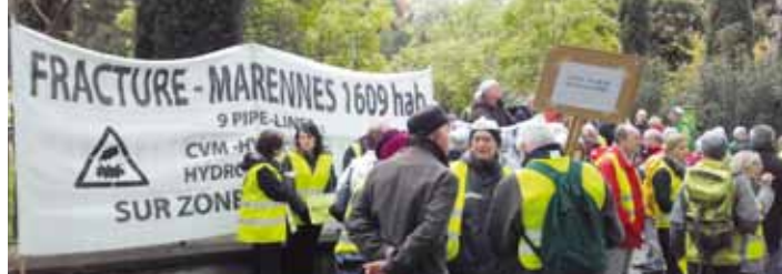
Les Marennois devant les jardins de la préfecture.

Environ 500 personnes étaient présentes pour manifester à la gare de FEYZIN et à la préfecture, ce qui fut un vrai succès vu les conditions météorologiques. Les Marennois ont pu utiliser le car mis à disposition par la mairie en plus des voitures pour participer à l'opération escargot jusqu'à la préfecture. Près de la moitié du conseil municipal était