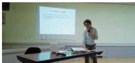
6 Conférence sur les écrans