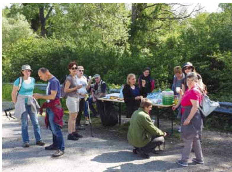
Halte pour les randonneurs au ravitaillement de Beyron.

Tous les participants ont terminé cette matinée en se rassemblant autour du verre de l'amitié.