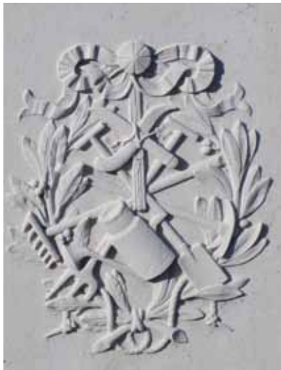
Sur la stèle, sculpture illustrant le métier du défunt : agriculteur.

Ils se sont rendus à l'église et au cimetière dans le but de répertorier les éléments ayant un intérêt patrimonial. Un état des lieux a été réalisé, première étape d'une démarche