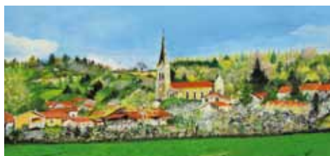
8 Fête du Village 13 Septembre 2015