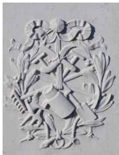
Sur la stèle, sculpture illustrant le métier du défunt : agriculteur.

Ils se sont rendus à l'église et au cimetière dans le but de répertorier les éléments ayant un intérêt patrimonial. Un état des lieux a été réalisé, première étape d'une démarche