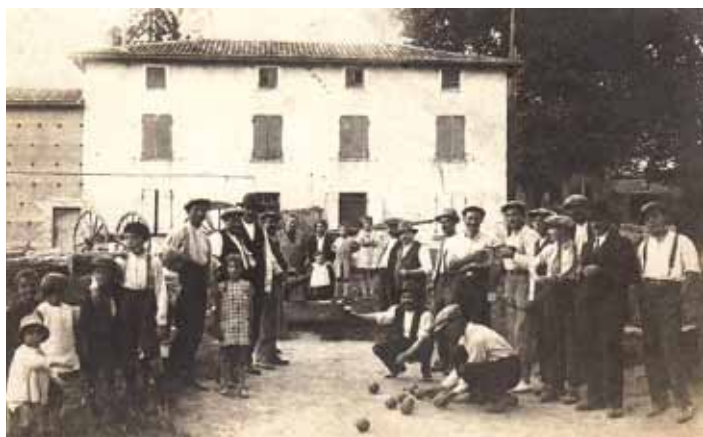
Les Marennois, en 1931, devant l'ancienne maison des associations, nous donnent l'exemple. Profitez de bons moments conviviaux pendant l'été !

Souhaiteriez-vous avoir une halte paisible dans votre commune pour continuer de tisser des liens dans une ambiance conviviale ? Pour vous ou pour vos parents âgés ? Pour tout renseignement, nous vous invitons à prendre contact avec la mairie.