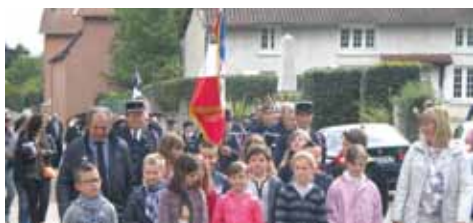
8 Commémoration du 8 Mai