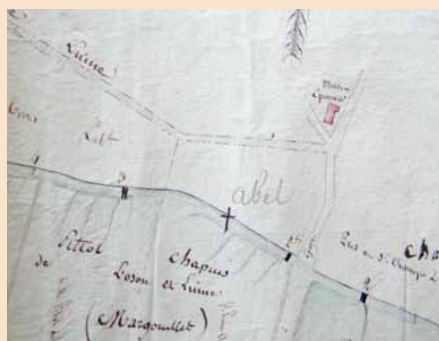
Extrait du plan : les N° 2, 2bis, 3, 4 représentent l'emplacement des vannes ou barrages pour l'irrigation de la plaine.