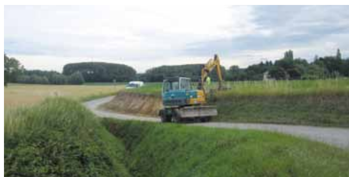
Chemin de Maupas.

Trop étroit dans le virage vers la départementale 150, le chemin va être élargi et le fossé consolidé par un enrochement.