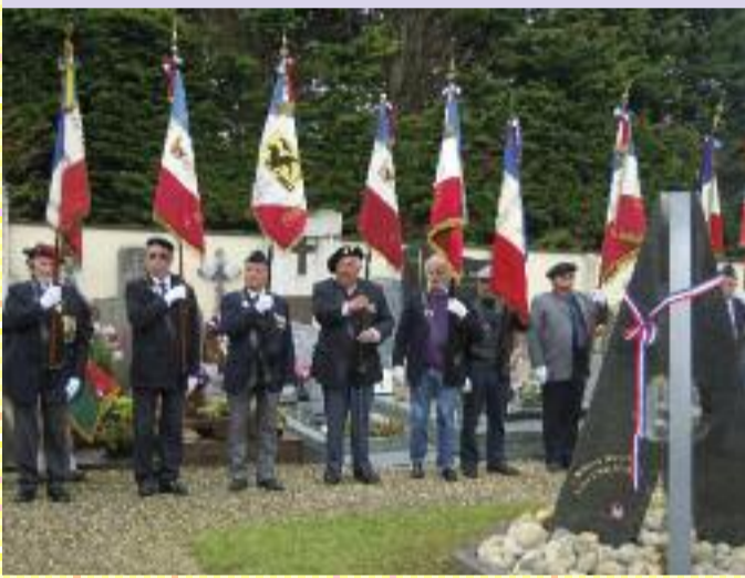
Les Anciens Combattants réunis lors de l'inauguration de la Stèle du Souvenir Français, le 25 mai 2013.

histoire nationale doit demeurer vivant. Le Souvenir Français compte sur vous pour participer à cet effort collectif, le maintenir, le renforcer pour tous ceux qui ont sacrifié leur vie pour nos libertés.