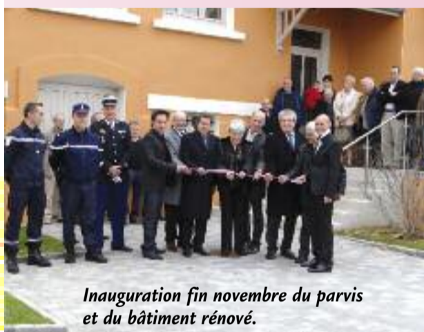
Inauguration fin novembre du parvis et du bâtiment rénové.