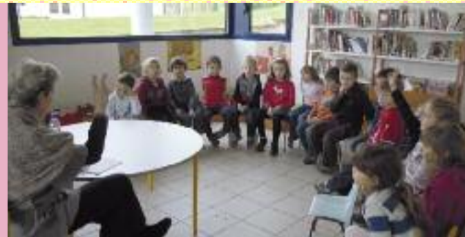
Visite à la bibliothèque des écoliers Marennois : Contes pour les petits du C.P.

Comme chaque année, le concours « Sang d'Encre » de Vienne, récompense par l'octroi du « Prix des Lecteurs Gouttes de Sang d'Encre » un écrivain de roman policier. Si vous aimez la lecture et désirez participer à l'attribution de ce prix, contactez l'un des bénévoles de la bibliothèque.