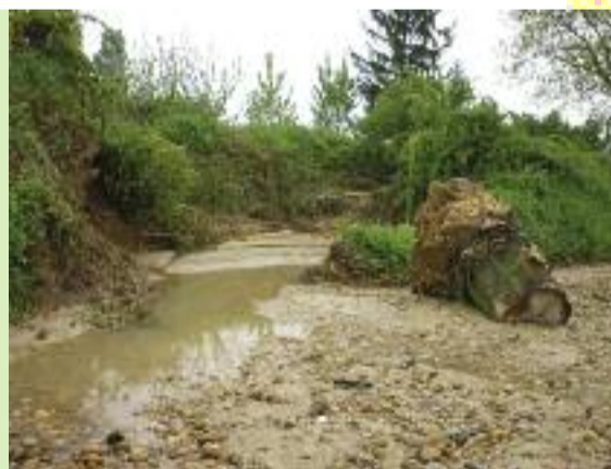
Rupture de la combe de Fausses, le 3 mai.

Soyons citoyens et respectueux de notre environnement. Evitons ces encombrements qui provoquent des barrages et sont ainsi la cause de débordements des bassins de rétention et des cours d'eau.