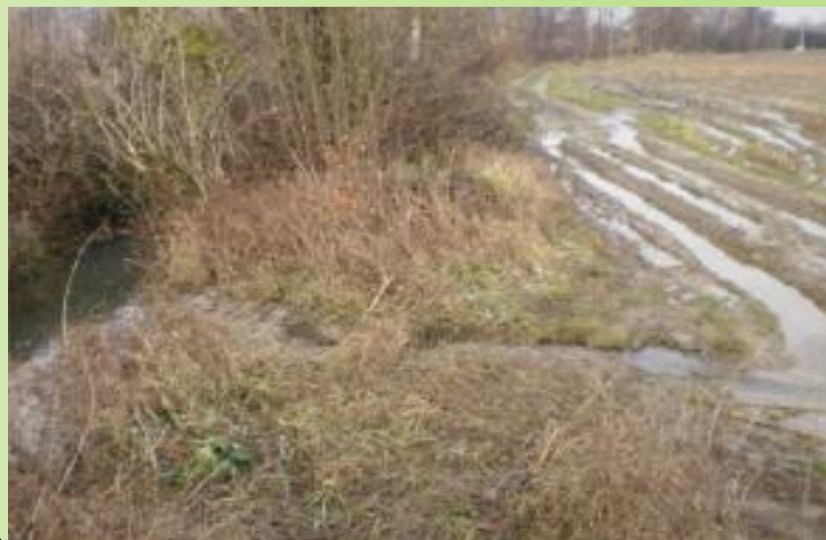
Rupture de la berge de l'Inverse.

La CCPO, seule compétente en ce domaine depuis janvier, a procédé à des travaux de réaménagement afin de reconstruire les berges.