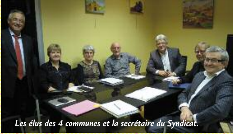
Les élus des 4 communes et la secrétaire du Syndicat.

Ce syndicat existait depuis les années 1960, il regroupait les communes du canton jusqu'en 1992, période du regroupement en intercommunalité.