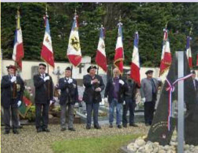
Les Anciens Combattants réunis lors de l'inauguration de la Stèle du Souvenir Français, le 25 mai 2013.

histoire nationale doit demeurer vivant. Le Souvenir Français compte sur vous pour participer à cet effort collectif, le maintenir, le renforcer pour tous ceux qui ont sacrifié leur vie pour nos libertés.