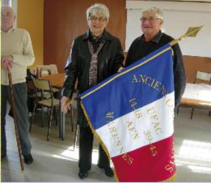
Remise officielle d'un nouveau drapeau pour la section des Anciens Combattants, fin 2012.