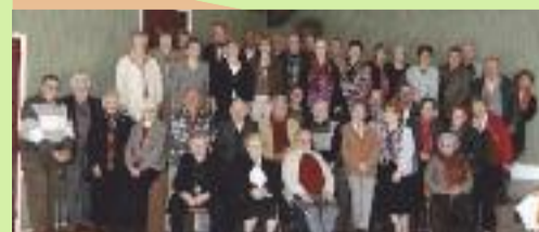
A.A.E.M., le 1 er Avril 2012.

Pour tous renseignements : 06 17 58 39 39