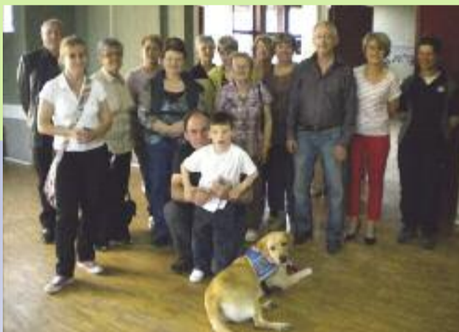
Petite réception pour la remise des chèques.