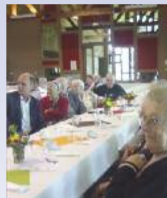
Goûter festif, Octobre 2012, salle des fêtes de Simandres.

L'association poursuit son objectif qui est de maintenir la personne âgée le plus longtemps à son domicile en lien avec la société qui l'entoure et envisage en 2013 l'ouverture d'une Halte Paisible, lieu d'accueil pour personnes âgées et handicapées.