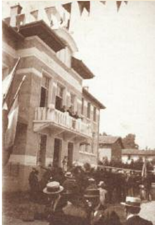
Inauguration du bâtiment le 7 Août 1932.

Comme chacun l'aura remarqué, notre mairie, cette année, s'est offert un grand coup de jeune... L'ensemble des murs en béton, après piquage, a été repeint.