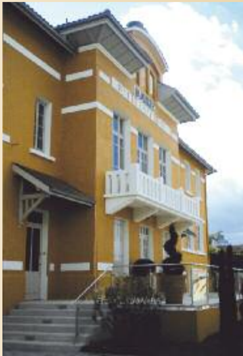
La mairie, Octobre 2012.

Côté rue, une plate-forme accessible par deux escaliers latéraux a remplacé le perron. Devant le bâtiment, une esplanade paysagée parcourue par un chemin piétonnier sécurisé, a vu le jour.