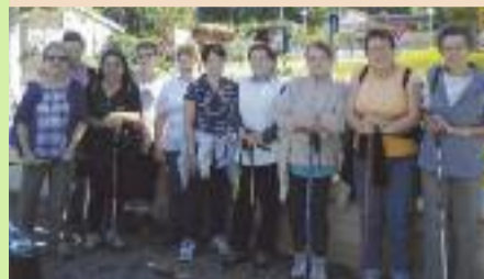
Les marcheuses, bâtons en mains, sont prêtes à partir sur les chemins Marennois.

La mise en place de la section marche, tous les mardis après-midi, permet aux adeptes, de partir à la conquête des chemins et sentiers Marennois ou environnant, encadré de trois bonnes marcheuses.