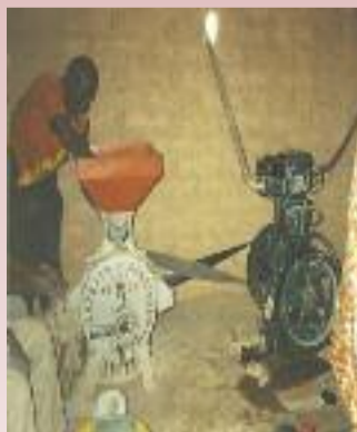
Le moulin à mil.

- Des ventes d'objets d'artisanat burkinabé, des manifestations festives (loto, repas dansant, soirée africaine, etc.) sont régulièrement organisées