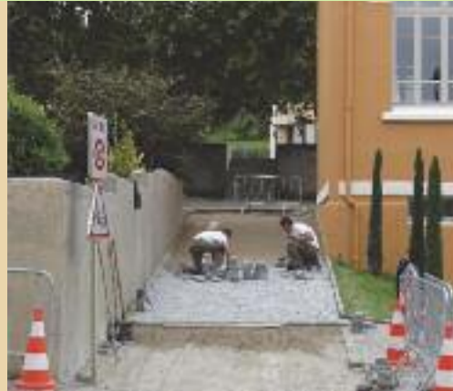
Pose des pavés.

Côté rue, une plate-forme accessible par deux escaliers latéraux a remplacé le perron. Devant le bâtiment, une esplanade paysagée parcourue par un chemin piétonnier sécurisé, a vu le jour.