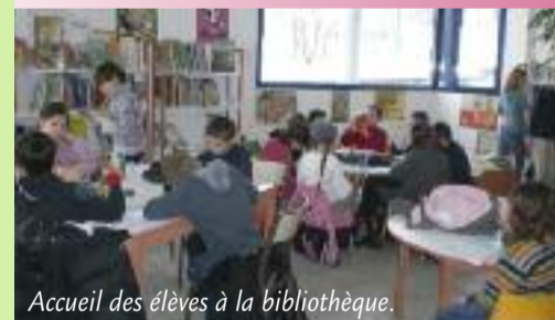
Accueil des élèves à la bibliothèque.

Vous avez reçu un questionnaire pendant l'été et vous avez déjà été nombreux à y répondre. Il n'est pas trop tard pour nous le retourner, si vous ne l'avez pas fait. Il est demandé à ceux qui sont intéressés par le portage de livres à domicile de bien vouloir se faire connaître à la bibliothèque.