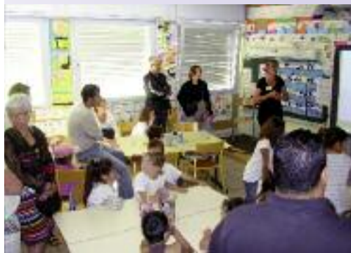
Démonstration du TBI aux parents lors des Portes Ouvertes de l'école le 28 Mai.