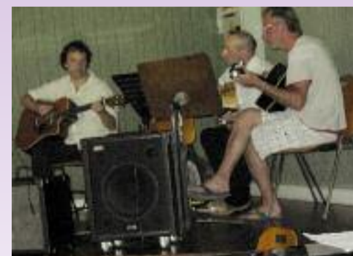
Audition de fin d'année.

A quelque niveau que ce soit et quel que soit l'âge du musicien, la pratique d'un instrument, par la satisfaction et la joie qu'elle procure, mérite que l'on y porte intérêt. La musique, un art accessible à tous au-delà des frontières et des préjugés, est également un art qui rassemble. Prenez le temps d'en parler avec l'un des trois bénévoles qui gèrent l'association pour vous en convaincre.