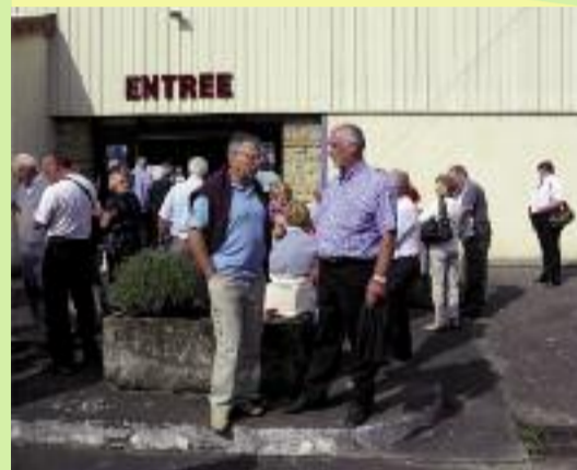
Journée à Digoin.

Le bilan à la mi-saison de la pétanque est très positif. L'année 2011 a vu grossir son effectif. Tous les mardis et vendredis, de nombreux joueurs et joueuses viennent se défier dans des parties de boules, qui finissent toujours dans la bonne humeur. Trois concours ont déjà été organisés avec de plus en plus de joueurs. La journée des sociétaires avec repas en fin de soirée, fut une réussite. Le voyage annuel a réuni 52 personnes pour une journée à Digoin, où nous sommes passés entre les gouttes.