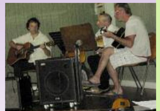
Audition de fin d'année.

A quelque niveau que ce soit et quel que soit l'âge du musicien, la pratique d'un instrument, par la satisfaction et la joie qu'elle procure, mérite que l'on y porte intérêt. La musique, un art accessible à tous au-delà des frontières et des préjugés, est également un art qui rassemble. Prenez le temps d'en parler avec l'un des trois bénévoles qui gèrent l'association pour vous en convaincre.