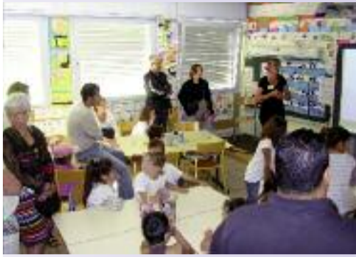
Démonstration du TBI aux parents lors des Portes Ouvertes de l'école le 28 Mai.