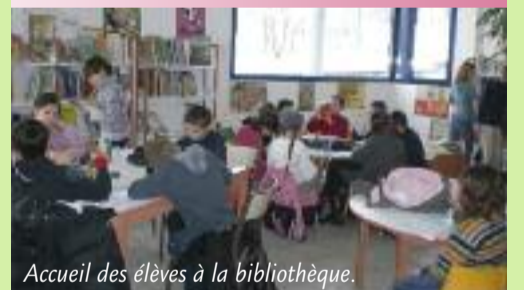
Accueil des élèves à la bibliothèque.

Vous avez reçu un questionnaire pendant l'été et vous avez déjà été nombreux à y répondre. Il n'est pas trop tard pour nous le retourner, si vous ne l'avez pas fait. Il est demandé à ceux qui sont intéressés par le portage de livres à domicile de bien vouloir se faire connaître à la bibliothèque.