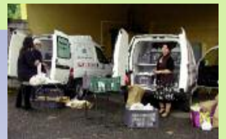
Préparation pour le portage des repas.

L'association participera également au Forum de l'Instance de Gérontologie qui aura lieu cette année à Corbas le samedi 29 Octobre et organisera son « Goûter Festif » lors de la semaine bleue le samedi 22 Octobre 2011. Toutes ces dates sont à noter sur vos agendas et peuvent être consultées sur notre site : http://www.aispa.fr