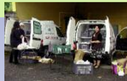
Préparation pour le portage des repas.

L'association participera également au Forum de l'Instance de Gérontologie qui aura lieu cette année à Corbas le samedi 29 Octobre et organisera son « Goûter Festif » lors de la semaine bleue le samedi 22 Octobre 2011. Toutes ces dates sont à noter sur vos agendas et peuvent être consultées sur notre site : http://www.aispa.fr