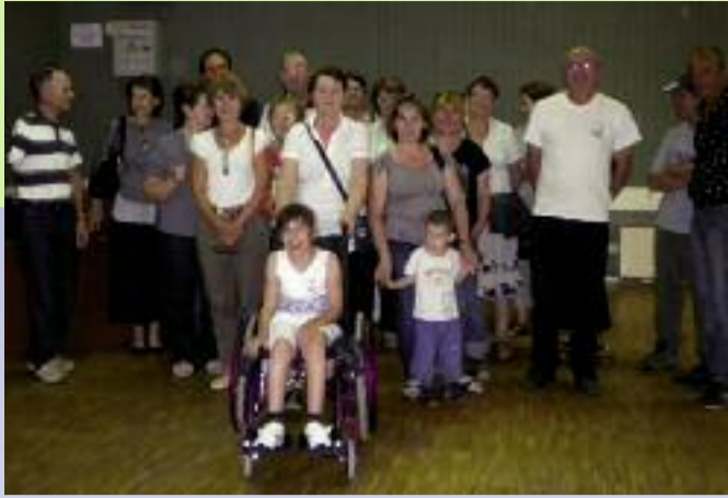
Petite réception pour la remise des chèques.